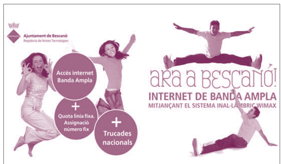
Imatge del cartell promocional.