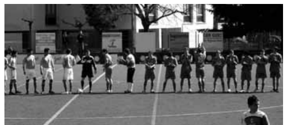
Partit entre la Selecció Mexicana - C.E. Bescanó.