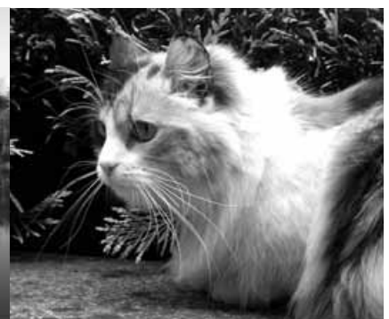
Dues fotos que es poden trobar a la galeria d'imatges de la pàgina web de la Torre