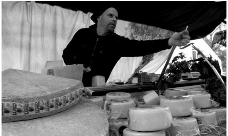
Un venedor ofereix un dels seus formatges per tastar.

Bescanó ha volgut agefir-se a aquesta campanya solidària aportant un total de 287 ampolles de gel i xampú i 152 pastilles de sabó, que afegits a la resta de material recollit a tot Catalunya van omplir 20 caixes de més o menys 250 kg. L'associació ACAPS Girona, que ha estat l'encarregada de fer arribar tot aquest material, agraeix la participació desinteressada del poble bescanoni.