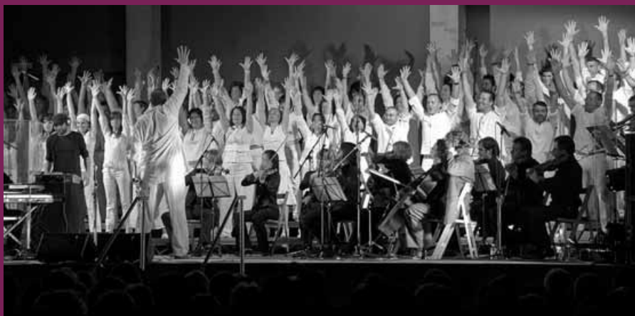
Diferents imatges de les jornades i del concert de gospel .

Les persones que hi vam ser presents, el que es va sentir i respirar en la posada en escena de les activitats musicals ho podríem resumir de diverses maneres, però hi ha dues paraules que ho poden sintetitzar: alegria i il·lusió i, al seu voltant, emocions, sensacions, descoberta d'un món musical divers i diversificat en les persones, però també en les metodologies, en les tècniques, en l'oferta, en el temps. Tot plegat amb un únic objectiu: gaudir amb la música i viure la música!