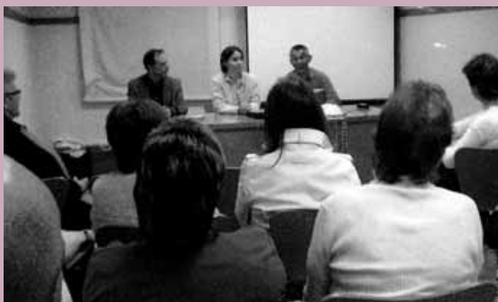
La xerrada es va centrar en els drets del malalt.

Seguidament, el Sr. Eduard Morales, advocat de l'Institut d'Assistència Sanitària (IAS), va completar la xerrada parlant-nos del dret del pacient oncològic a la informació de la malaltia i del seu tractament.